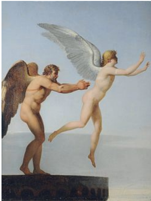
Figura 1– Ícaro e Dédalo Fonte: Charles Paul Landon

O homem sempre observou a aviação com fascínio, podemos lembrar que dentre os contos mitológicos temos a saga heróica de Ícaro, que juntamente com seu pai Dédalo engenhosamente criaram dois pares de asas brancas com a junção de cera e penas de gaivotas, com o escopo de livrarem-se do cativoiro imposto pelo Rei Minos (Mitologia Grega).