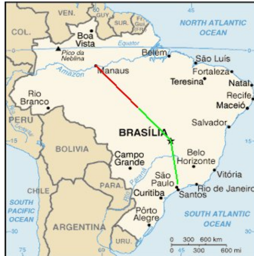
Figura 2– Mapa mostrando a rota dos dois aviões

Percurso do Boeing 737 Percurso do Legacy 600