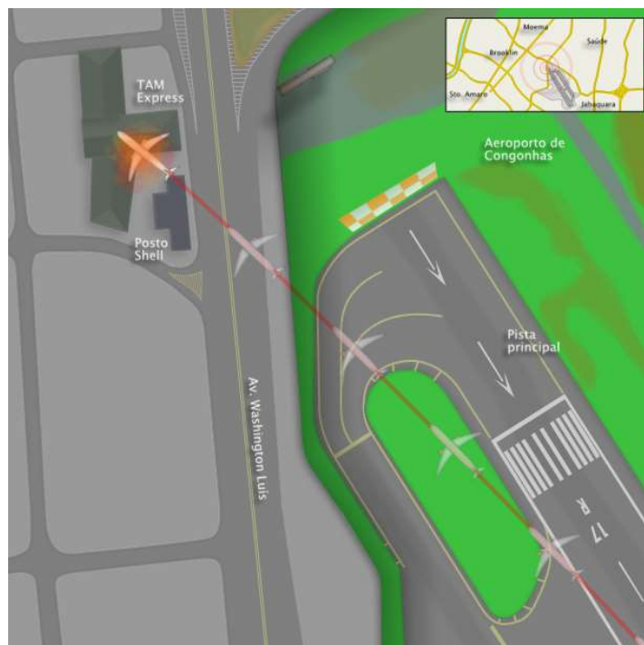
Figura 4- Trajetória da aeronave após o pouso